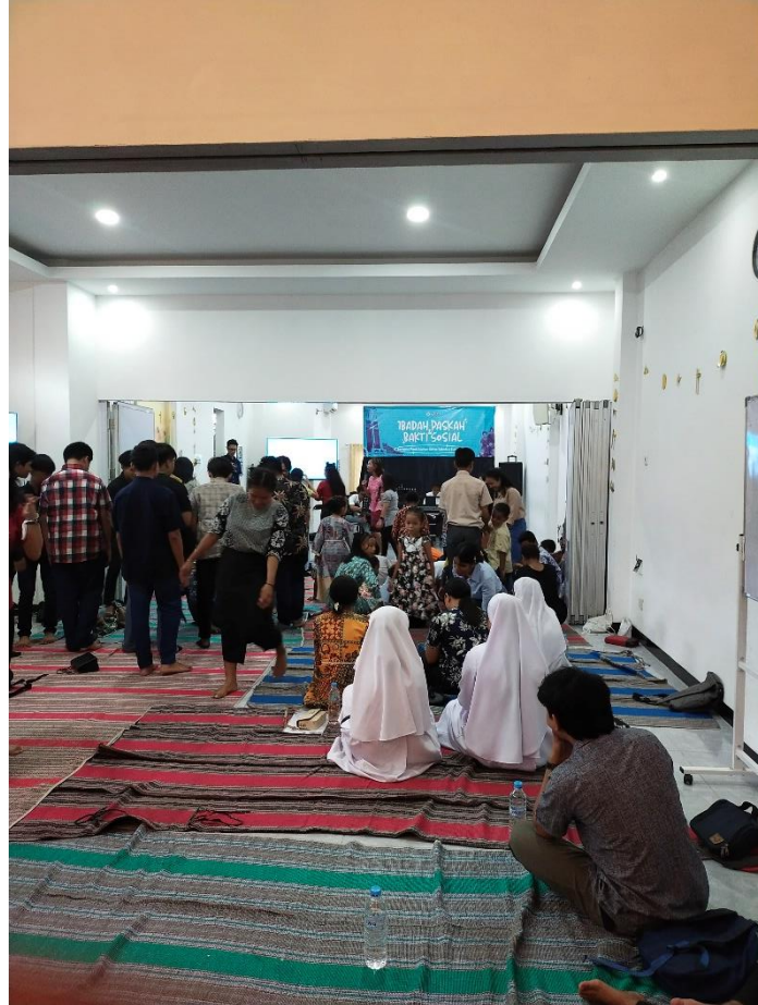
Lampiran 3 Kegiatan Berbagi Kasih Bersama Pantti Santo Yakobus Surabaya