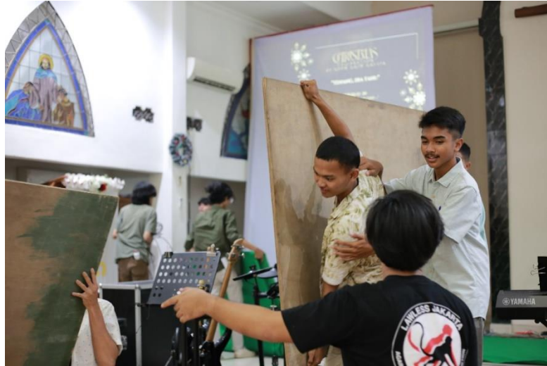
Lampiran 2. Kegiatan Dekorasi Gedung Gereja Perayaan Natal