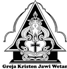
Gambar 1. Logo GKJW