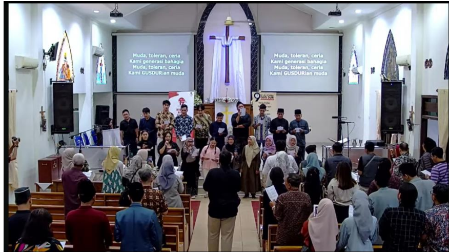
Lampiran 3 Kegiatan Lintas Agama Bersama Organisasi GUSDURian